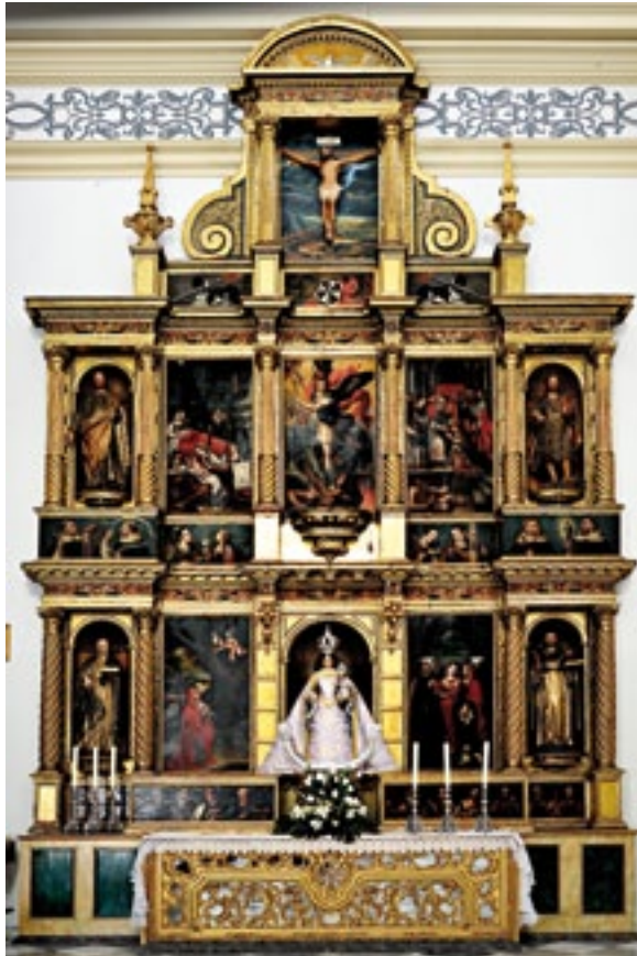
Retablo de San Miguel. Altarpiece of San Miguel.

The earlier alcove had paintings by Pablo Sístori, and houses this famous sculptor's group showing Santa Ana, for whom the church is named, teaching the Virgin to read. Once the church was open for worship, other works then enhanced it, such as the re-design of the main chapel (the chapel of the Tránsito (1763)), the lookout tower and the doors (1751), and the organ, by Matías Salanova.