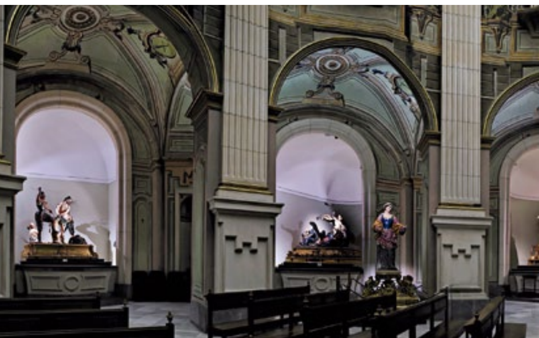
Panorámica del interior con los pasos de Salzillo. Interior panorama with Salzillo's pasos.