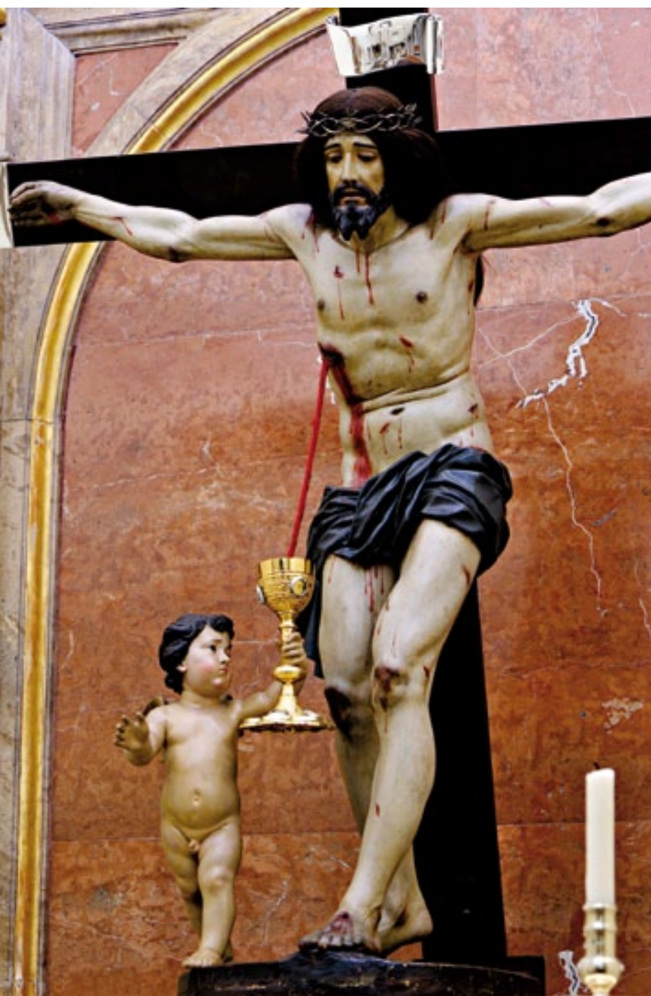
Iglesia del Carmen. Cristo de la Sangre. Nicolás de Bussy. Church of the Carmen. Cristo de la Sangre. Nicolás de Bussy.