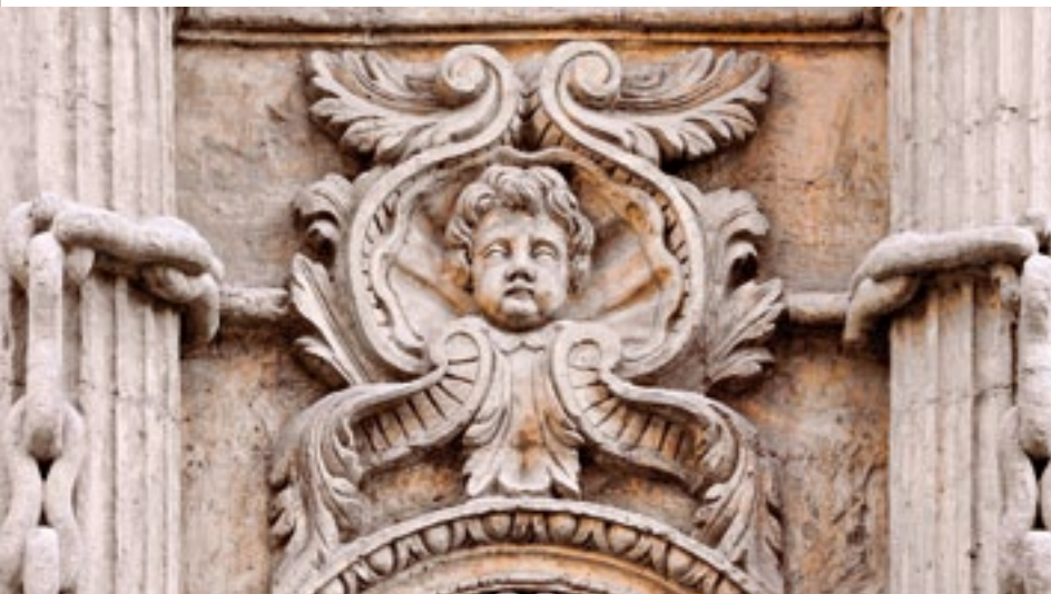
Portada principal. Main doorway.

Close by the university, the Convent of La Merced, a foundation of the order dedicated to the freeing of captives, built a marble cloister at the beginning of the seventeenth century (1607), which was created by the stonemason Damián Pla. Today, it houses the Faculty of Law. The church, presided over by the José Balaguer and Salvador de Mora's 1713 façade, has a sculptural quality, but its brilliant interior, now home to the Franciscan order, reveals how decorative elements can elicit emotional responses.