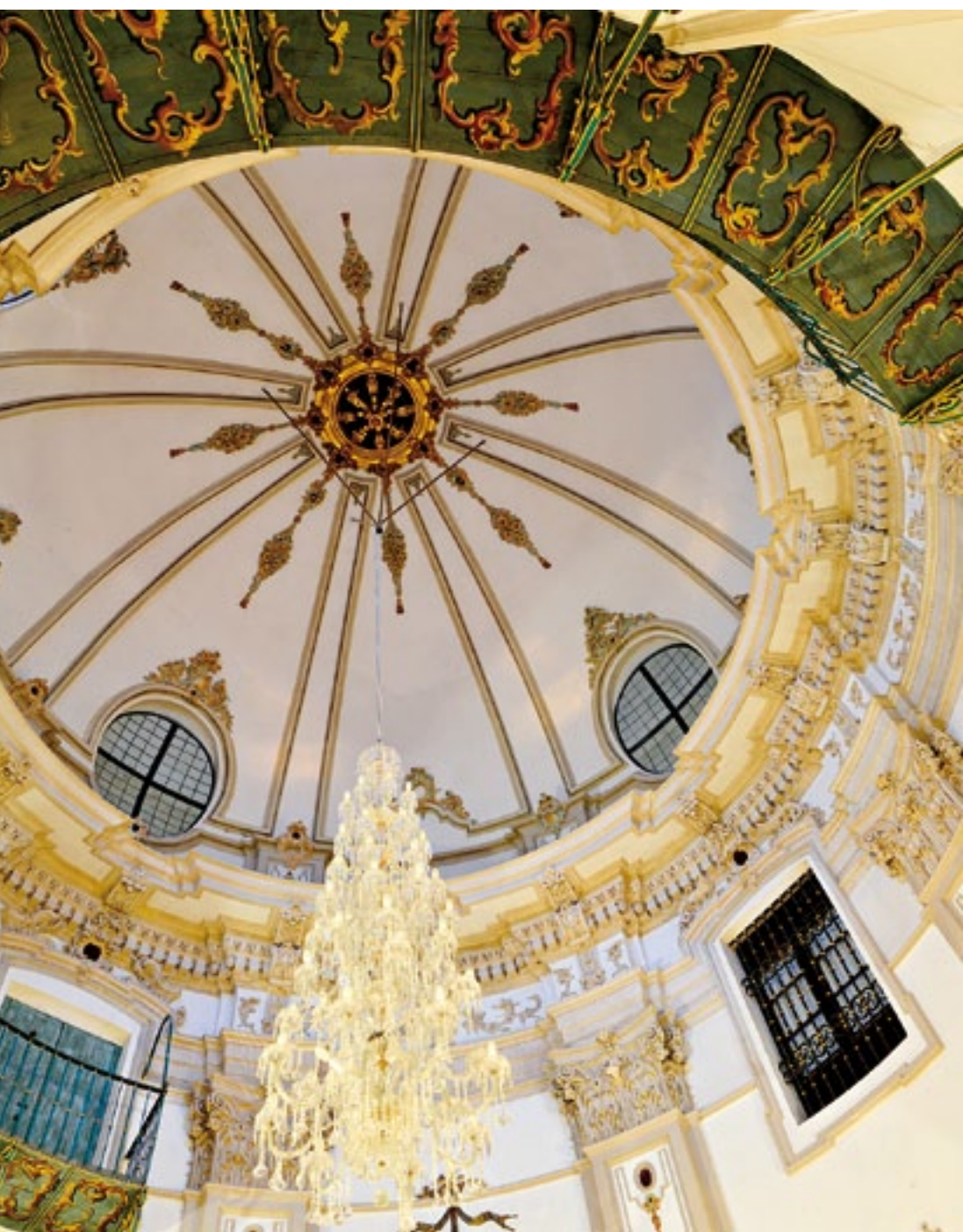
Palacio Episcopal. Cúpula de la capilla. Episcopal Palace. Chapel dome.