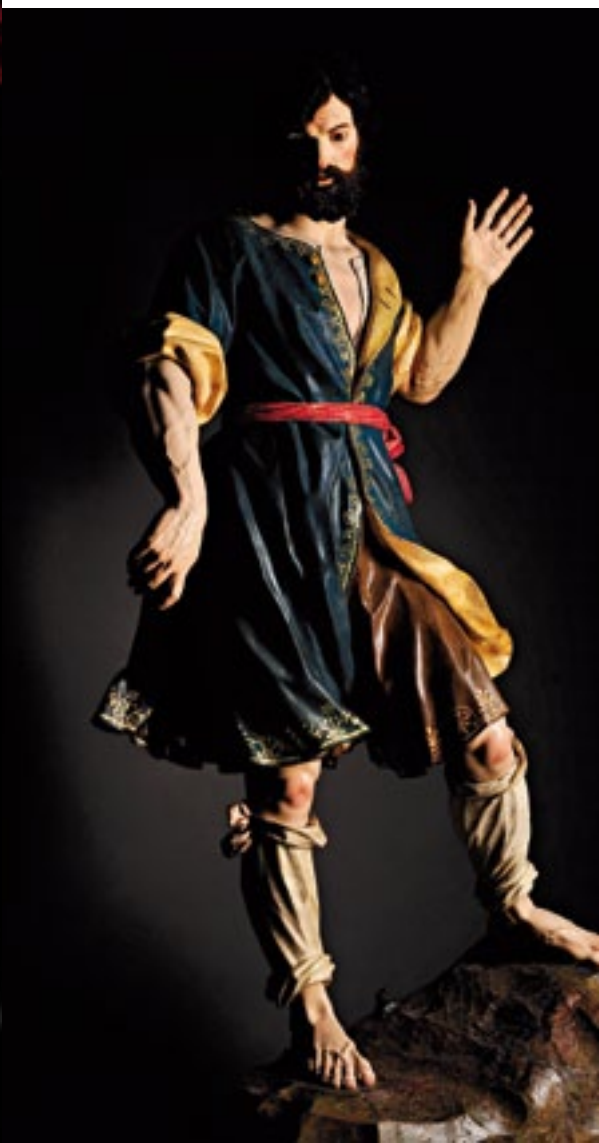
Detalle de San Isidro Labrador de Salzillo. Detail of San Isidro Labrador, by Salzillo.