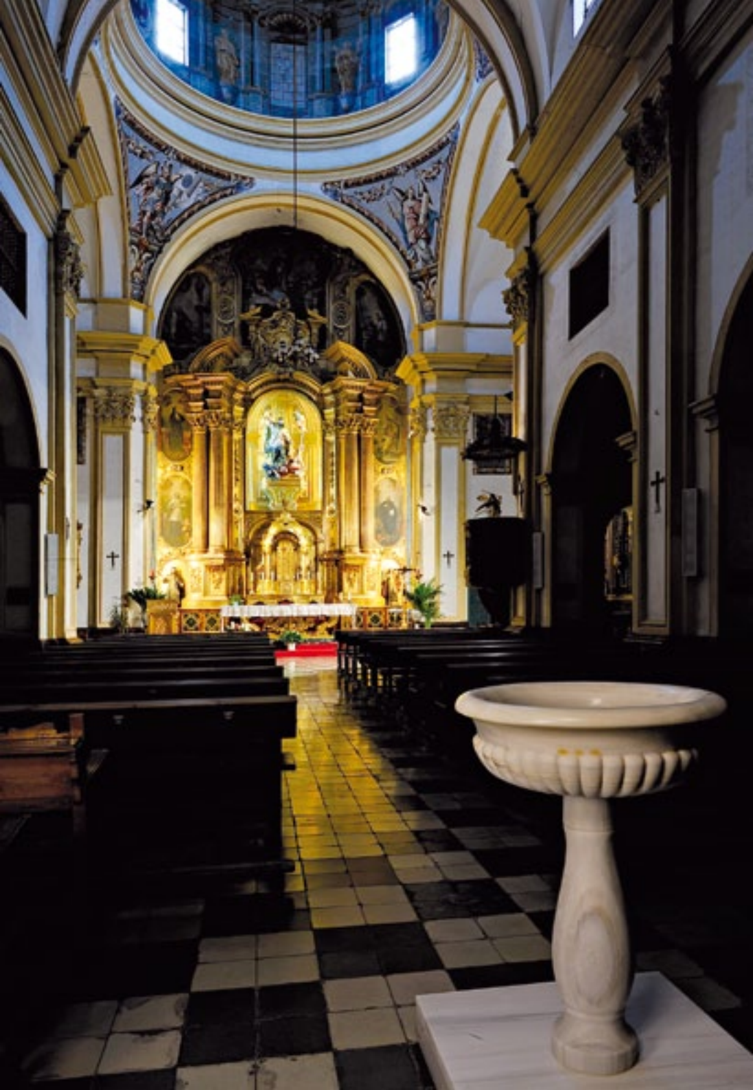
Nave principal y retablo mayor. Nave and main altarpiece.