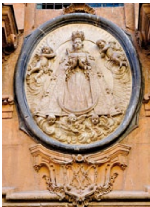
Detalle de la portada. Detail - cover page.