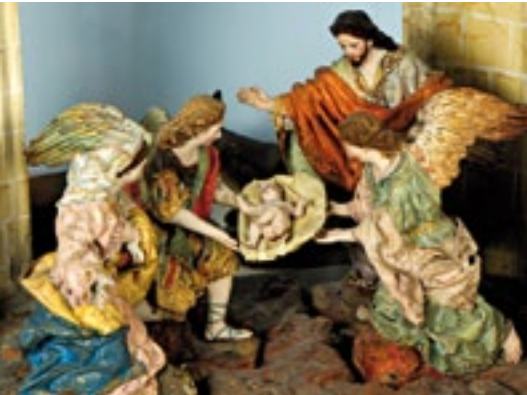
Museo Salzillo. Detalle del Belén. Museo Salzillo. Detail of Belén.

Between 1752 and 1777, Salzillo made the famous pasos (devotional statues) for the morning processions of Good Friday, managing to conjure a harmonious experience with the pellucid architecture and the narrative possibilities of sculpture. In the galleries, there are still some surviving paintings by Pablo Sístori, from 1792. In the rooms of the Museo Salzillo, the most famous baroque collection in the city is completed by a splendid collection of the master's sketches, and the famous Belén (Nativity Scene) belonging to the Riquelme family.