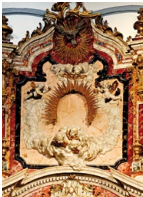
Coronamiento del retablo mayor. Main altarpiece capstone.