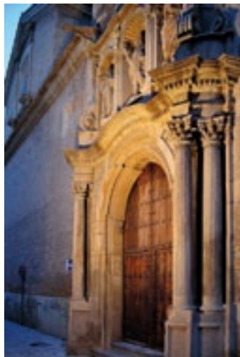
Detalles de la portada principal. Details of main entrance.