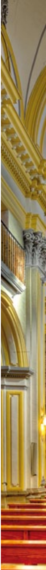
Viña del interior. View of the interior.