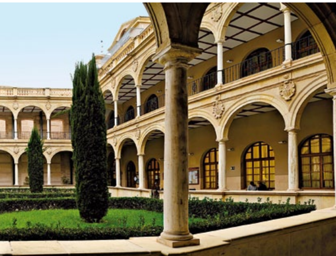
Claustro de La Merced, hoy Universidad. Cloister of La Merced, now part of the University.

The whole church seems in thrall to the famous main altarpiece, and by the apotheosis of the founding order. Erected in 1744, and based on designs incorporated by Jaime Bort into the main cathedral façade, it is of a monumental character only comparable to a few other examples in the city. Other riches of the church include sculptures by Nicolás Salzillo – a Nazareno and one of San Ramón Nonato – and a panel relating the discovery of the Virgen del Cuello Tuerto (Virgin with the Turned Neck) and the reason for her unnatural posture. Other canvases by Lorenzo Suárez and Cristóbal de Acevedo complete the mercedarian legacy.