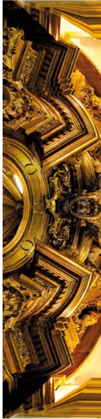
Cristo de la Esperanza de Salzillo. Salzillo's Cristo de la Esperanza.