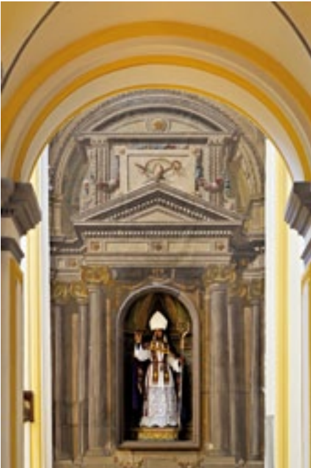
Retablo de San Blas. Altarpiece of San Blas.