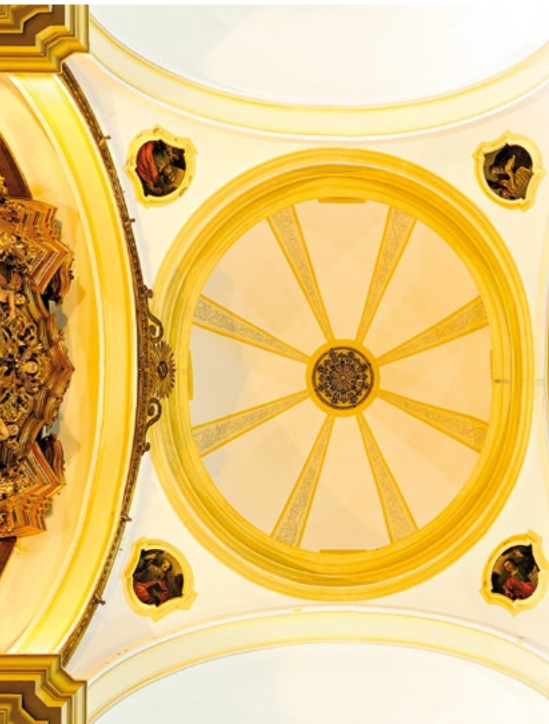
Detalle de la cúpula. Details of the dome.