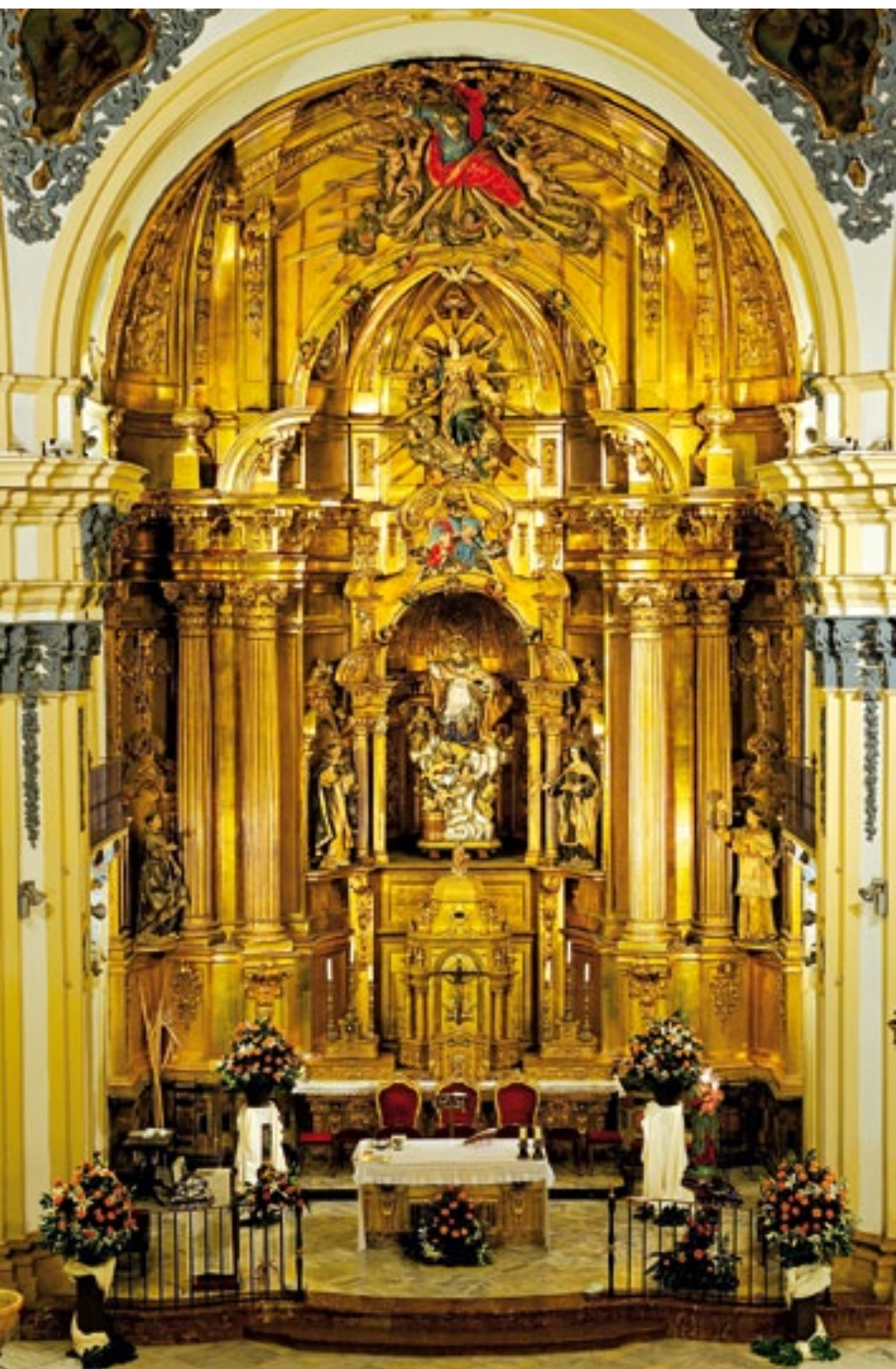
Retablo mayor. (arriba) Detalles de la fachada de poniente. Main altarpiece. (above) Details of the western façade.