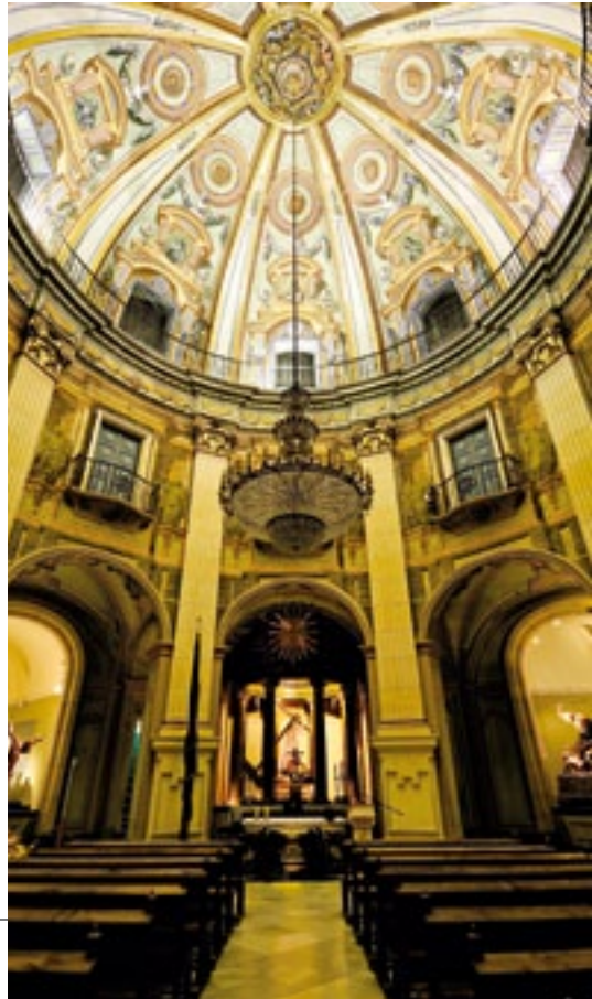
Cúpula y tribuna. Dome and gallery.