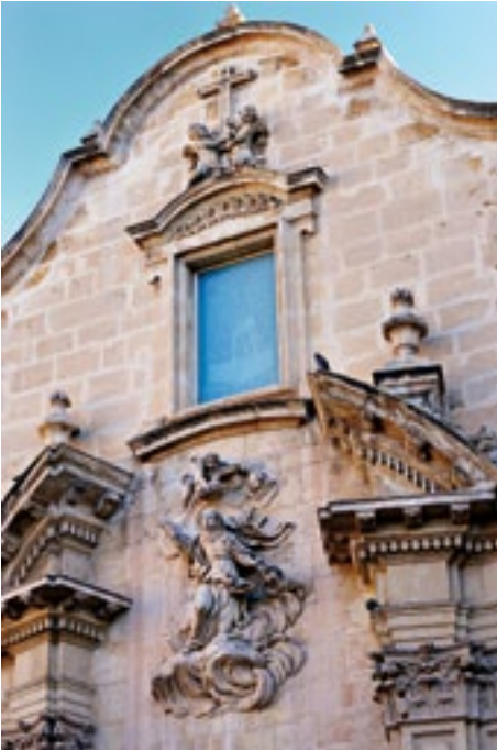
Relieve de Pedro Federico. Relief sculpture by Pedro Federico.