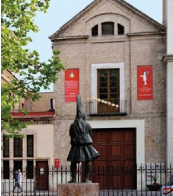
Museo de la Sangre. Museo de la Sangre.