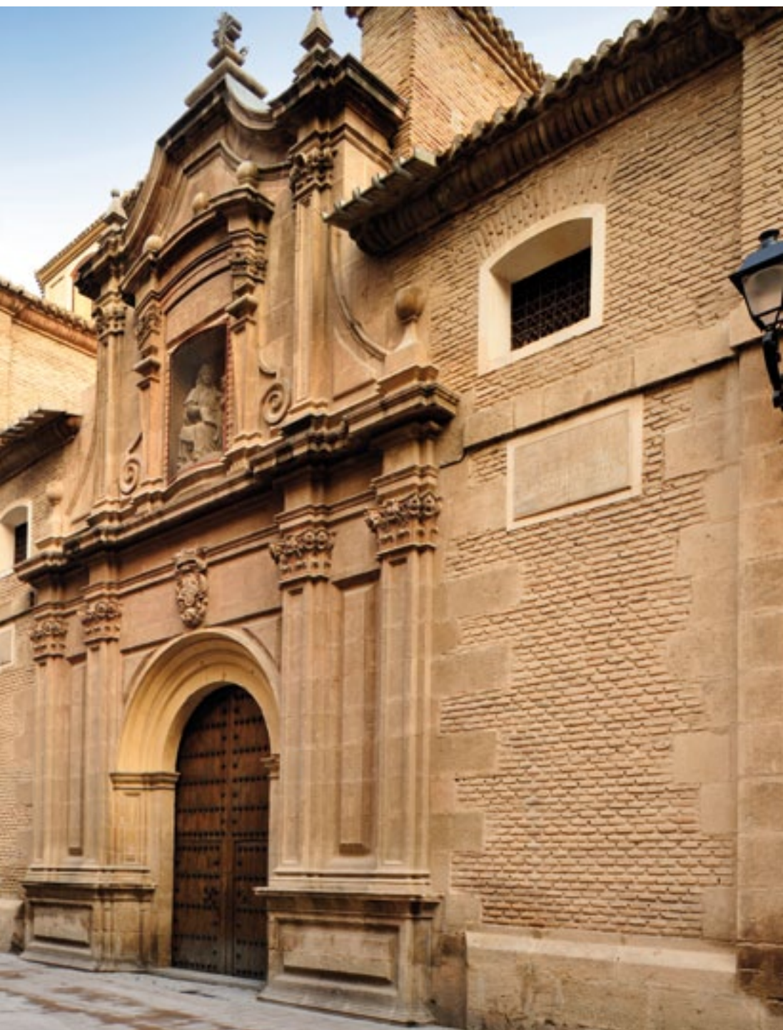
Fachada principal. Main façade.