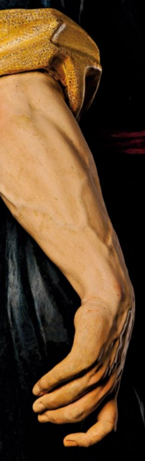
San Isidro Labrador de Salzillo. San Isidro Labrador, by Salzillo.