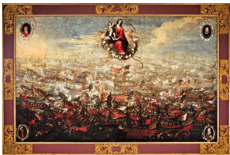
Batalla de Lepanto. Battle of Lepanto.